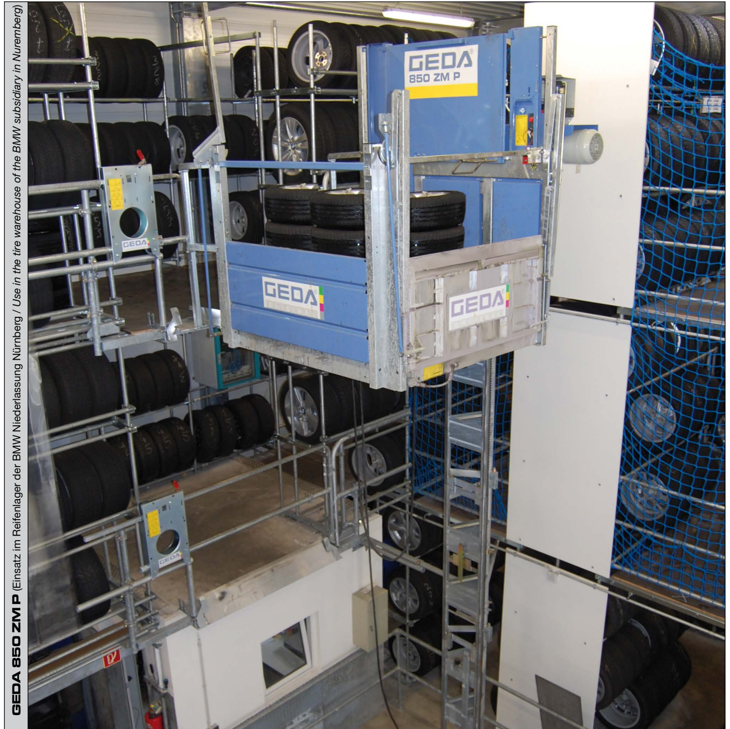
GEDA 850 ZM P (Einsatz im Reifenlager der BMW Niederlassung Nürnberg / Use in the tire warehouse of the BMW subsidiary in Nuremberg)